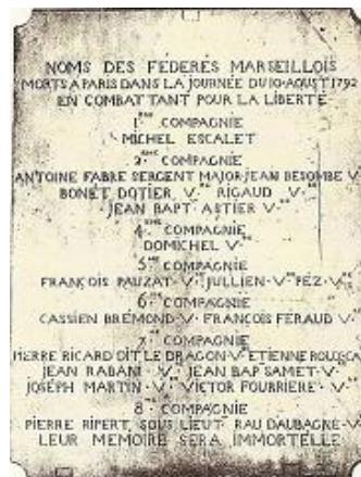
©Plaque apposée sur un mur de la Mairie de Marseille

Le 10 août 1792 occupe une place à part dans l'histoire de la Révolution française. On peut presque dire que le peuple s'est, ce jour là, affirmé maître de son propre destin.